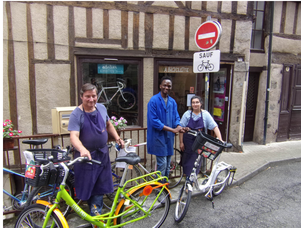
Local et atelier d'À Bicyclette