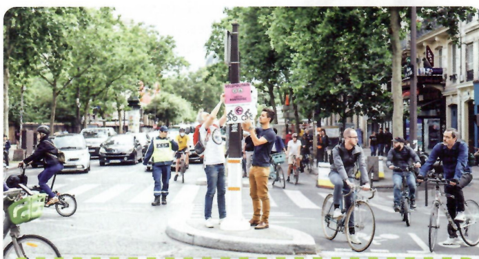
10 juin 2020, à Paris, les panneaux des pistes doublant les lignes de métro sont posés par Paris en selle, à défaut d'être réalisés par les services de la mairie de Paris