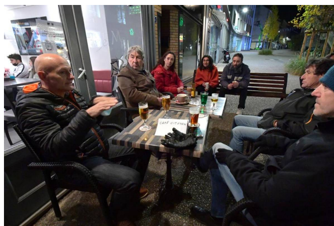
café citoyen sur la mobilité au Molière